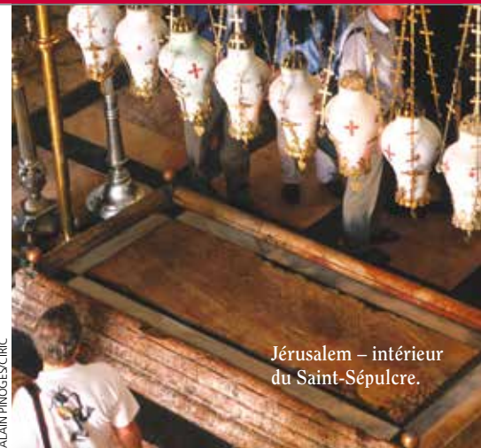
Jérusalem – intérieur du Saint-Sépulcre.