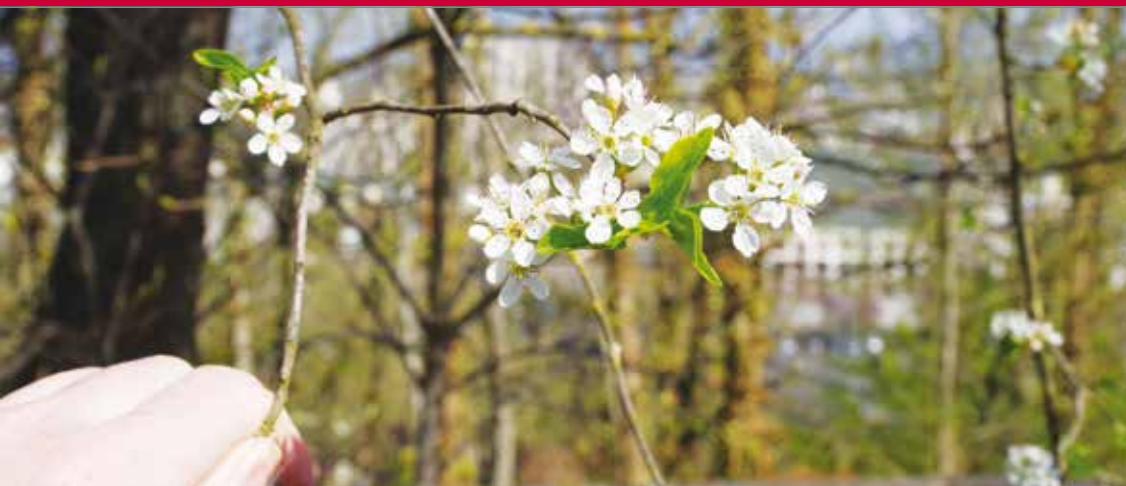
Les prunelliers en fleur annoncent le printemps.