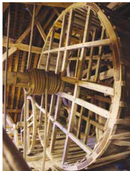
La roue à écureuil.