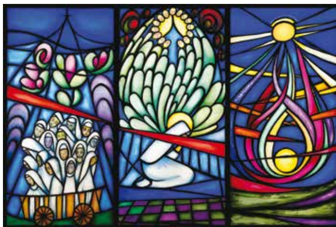
Artiste : Vianefe

Enfin, nous sommes invités à prier pour notre monde qui connaît une crise grave par l'intercession des bienheureuses carmélites de Compiègne, afin que la paix puisse être rétablie.