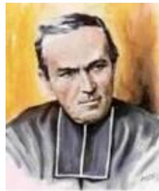
P. Antoine CHEVRIER

Aujourd'hui, le pape François ne nous encourage-t-il pas à vivre « en sortie » vers toutes les périphéries de notre monde dans l'esprit de l'Évangile ?