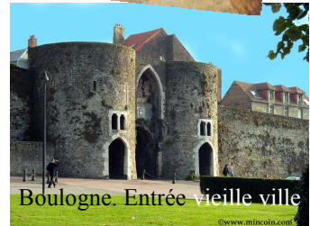
Boulogne. Entrée vieille ville