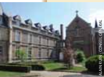
ALAIN RUIN - CONSEIL GÉNÉRAL