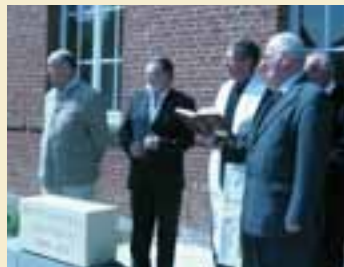
Pose de la première pierre.

Dans le but de répondre aux besoins pastoraux, le conseil pastoral a souhaité pouvoir disposer de salles de réunion : catéchisme, préparation aux baptêmes, confirmations, mariages, Action catholique des enfants (ACE), Mouvement rural de jeunesse chrétienne (MRJC), conseil pastoral, conseil économique... La paroisse dispose dans le centre ville d'un terrain sur lequel est édifié un bâtiment en briques du XIX e siècle. La salle existante sera rénovée et une seconde salle de réunion sera construite sur ce terrain dans un volume identique au bâtiment actuel, par ses matériaux et ses ouvertures. Ce nouveau bâtiment sera monté perpendiculairement entre celui existant et la rue. Pour bien distinguer les deux constructions, un hall d'accueil tient lieu de trait d'union. Le terrain sera aménagé en places de parking et en aire de détente.