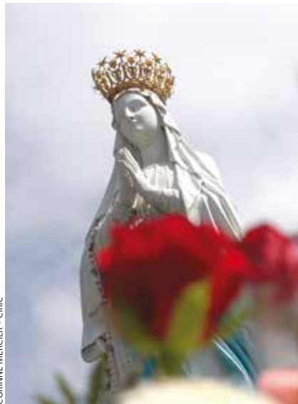
CORINNE MERCIER - CIRC