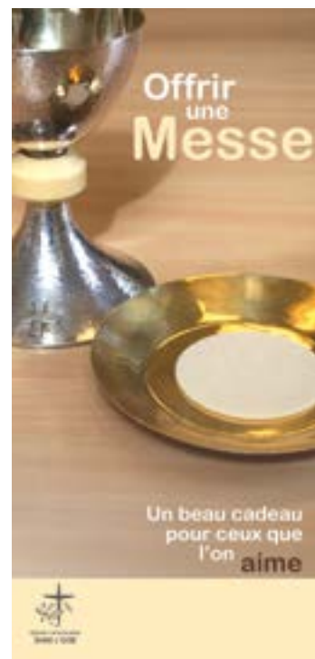
Dépliant « Offrir une messe », disponible en paroisse