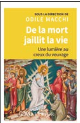
Ed. Salvator, 190 p, 20€