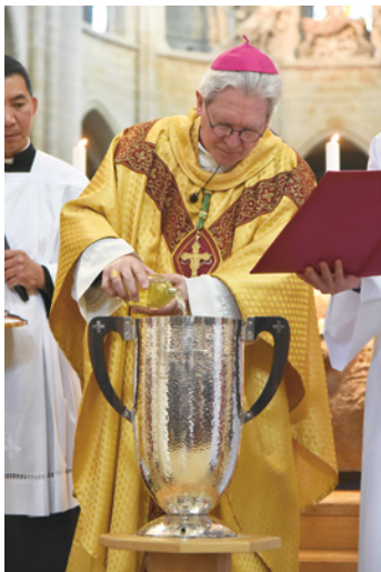
Messe chrismale, Senlis, le 4 avril 2023.

Chaque année, dans tous les diocèses du monde, prêtres, diacres et fidèles se réunissent pour célébrer la messe chrismale. Elle est célébrée le plus souvent au matin du Jeudi Saint en souvenir de l'institution de l'eucharistie, mais peut être anticipée. C'est au mardi de