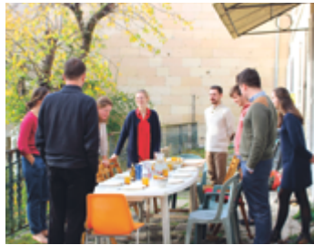
Prieuré d'Attichy, novembre 2020