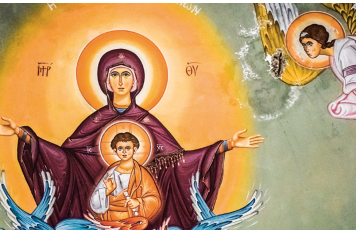
Église d'Ayia Napa (Chypre)