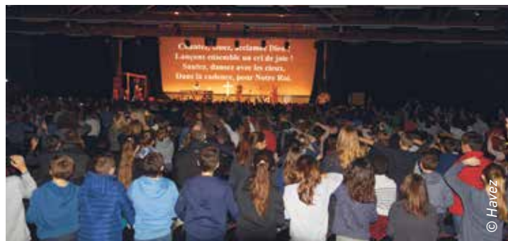
Avent 2017, pôle événementiel Le Tigre, Margny-lès-Compiègne

1000 jeunes sont attendus au rassemblement de l'Avent pour les collégiens de 6 e et 5 e qui aura lieu à Margny-lès-Compiègne le dimanche 1 er décembre.