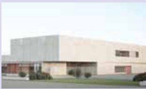
Ecole Notre-Dame de la Providence à Clermont.

L'Enseignement catholique de l'Oise a engagé un important programme de chantiers de rénovations, constructions, améliorations. En voici quelques exemples :