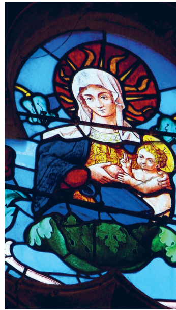
Vitrail de l'arbre de Jessé

Écho vous invite à redécouvrir les trésors méconnus abrités par les églises de l'Oise. Laissez-vous émerveiller !