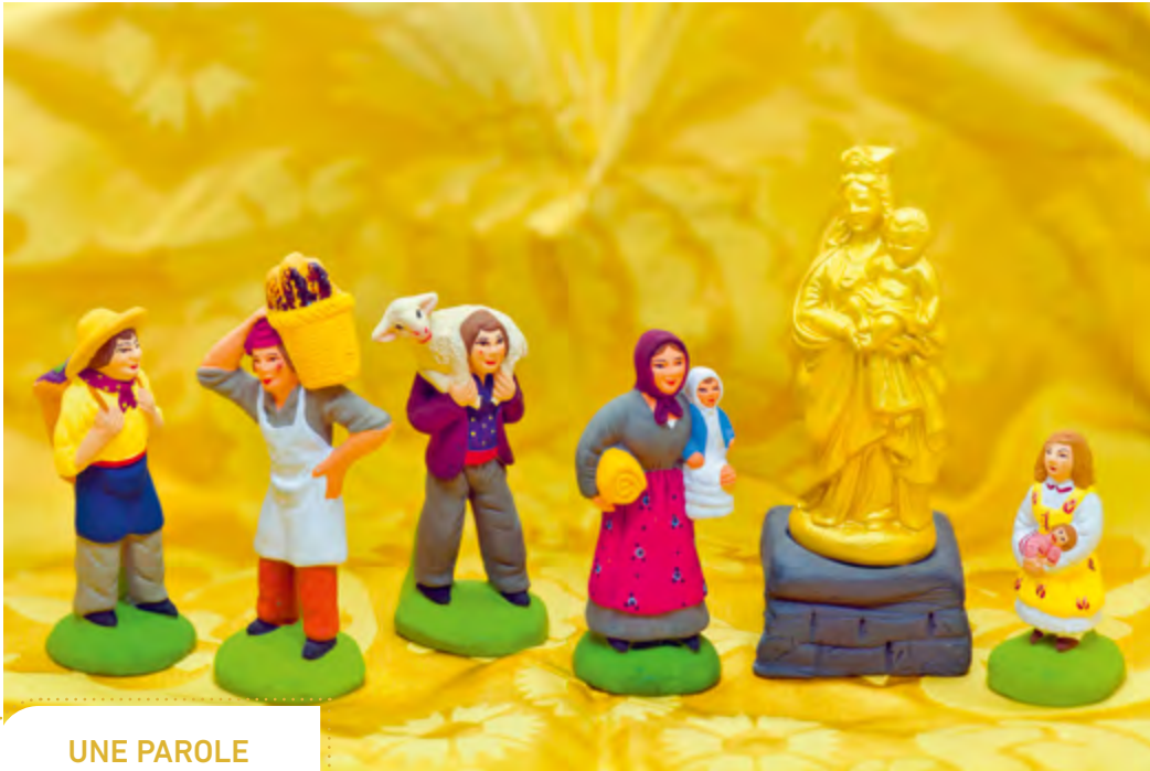
Santons de Provence