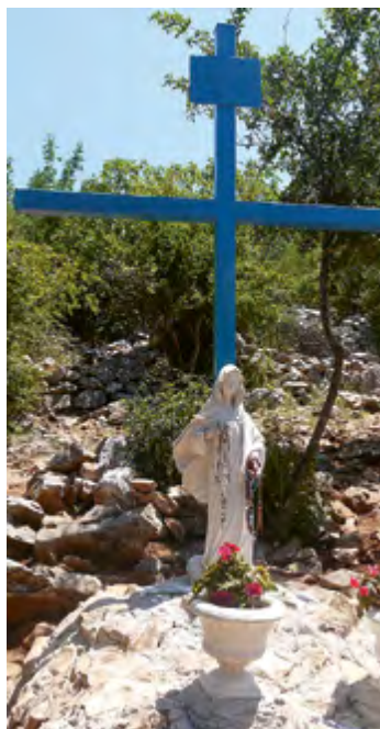
Colline des croix bleues