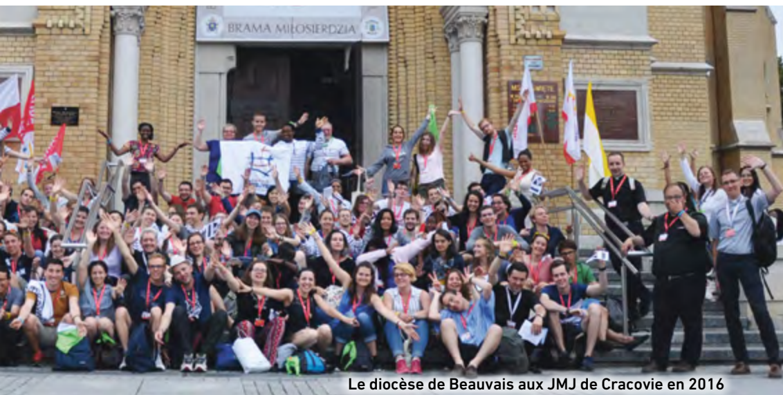
Le diocèse de Beauvais aux JMJ de Cracovie en 2016

uniquement par des évêques. De plus le comité d'organisation travaille activement à réduire l'impact environnemental de ces JMJ.