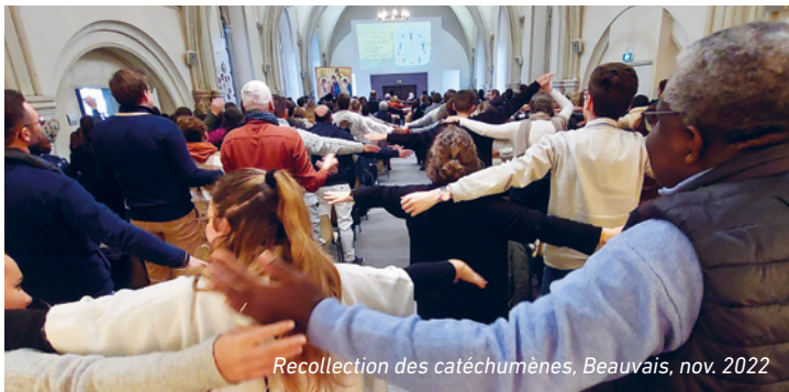
Recollection des catéchumènes, Beauvais, nov. 2022

En général nous avons tendance à réduire le catéchuménat à une simple préparation à recevoir les sacrements d'initiation chrétienne (baptême, confirmation, eucharistie).