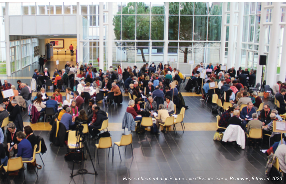
Rassemblement diocésain « Joie d'Évangéliser », Beauvais, 8 février 2020

> Se mettre à l'écoute de la Parole de Dieu - Parole de Vie pour chacun - et des cris du monde, des proches comme des lointains.