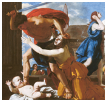
La massacre des Innocents, Nicolas Poussin (Château de Chantilly)