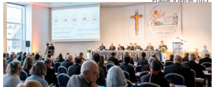
Prague, 6 février 2023

Il s'agit d'approfondir le discernement sur ce qui a émergé de la phase d'écoute locale et nationale, de formuler plus précisément les questions ouvertes, et de mieux étayer les idées. C'est aussi l'occasion d'écouter