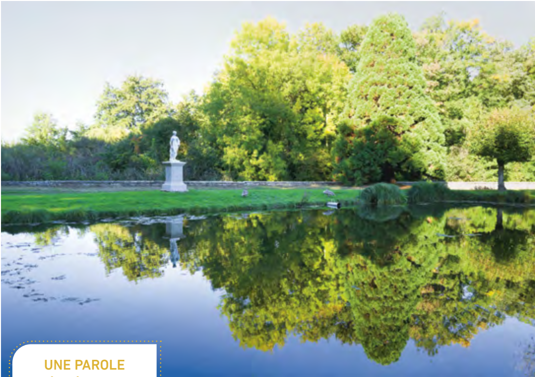
Le parc du Domaine de Chaalis, Oise