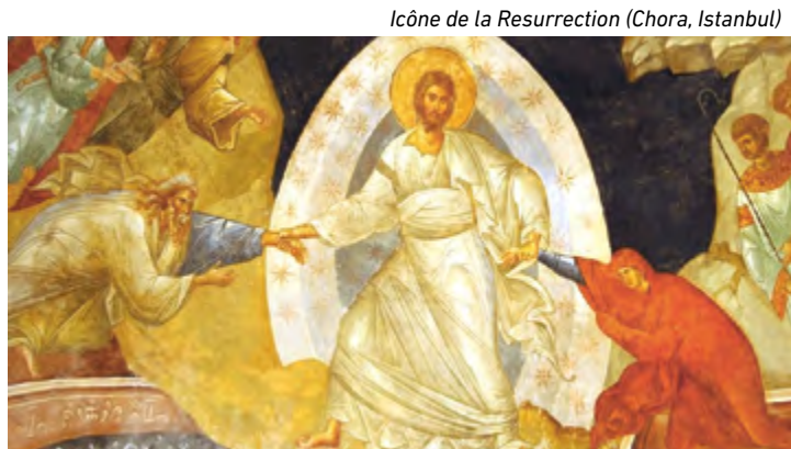
Icône de la Resurrection (Chora, Istanbul)

OUI parce que dans une société sans repères chrétiens, pour des familles très éloignées de l'Église, il nous revient la mission d'annoncer de façon explicite que Dieu aime l'Homme, qu'Il veut son bonheur, qu'Il a envoyé son Fils, Jésus Christ, incarné puis mort et ressuscité pour nous sauver. En témoigner au moment d'un deuil