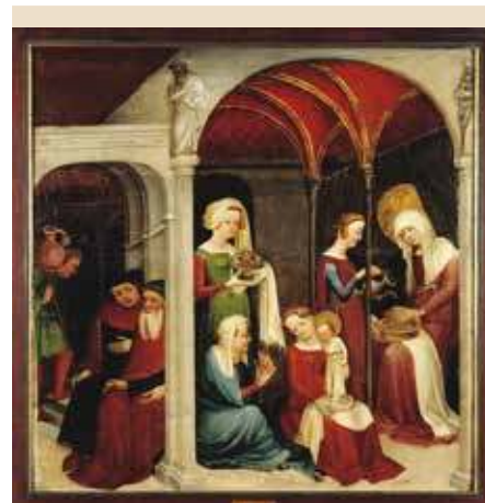
La nativité de la Vierge du Maître du Haut-Rhin.