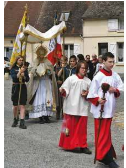
Procession de la Fête Dieu à Verberie cette année.

La tradition chrétienne a de tout temps organisé des célébrations en dehors des églises, que nous connaissons sous le nom de processions. À une époque où certains craignent les expressions religieuses publiques et où le prosélytisme pourrait s'appuyer sur une revendication d'appropriation du lieu par la prière, il est important de situer notre pratique qui perdure sans toutefois les fastes d'antan. Nos processions, aux rogations, à la Fête-Dieu, au 15 août ou sur des lieux de pèlerinage... veulent exprimer l'incarnation de notre foi et son lien avec les réalités temporelles qui sont les nôtres. La foi chrétienne est à l'opposé d'un spiritualisme égocentré et d'une mystique qui voudrait nous faire échapper à ce monde matériel. Processionner, c'est aussi «aller vers», et donner sens au déroulement de nos vies par l'affirmation d'un but à atteindre. Enfin les processions, tout en voulant éviter les