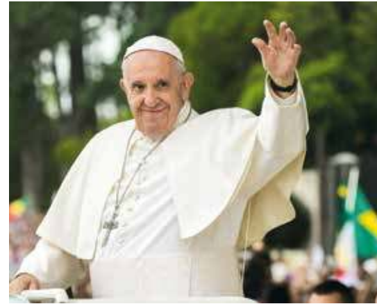
Le pape François à Fatima (Portugal), en 2017.

Bien souvent, nous sommes émerveillés par la beauté qu'offre la Terre. Mais savons-nous encore la regarder? Savons-nous la partager? Saurons-nous la transmettre? La nature nous trans-