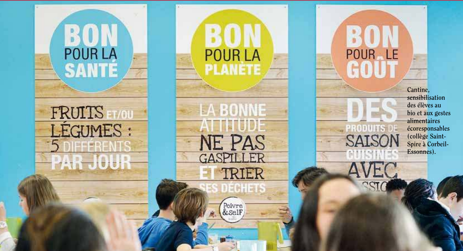
Cantine, sensibilisation des élèves au bio et aux gestes alimentaires écoresponsables (collège Saint-Spire à Corbeil-Essonnes).