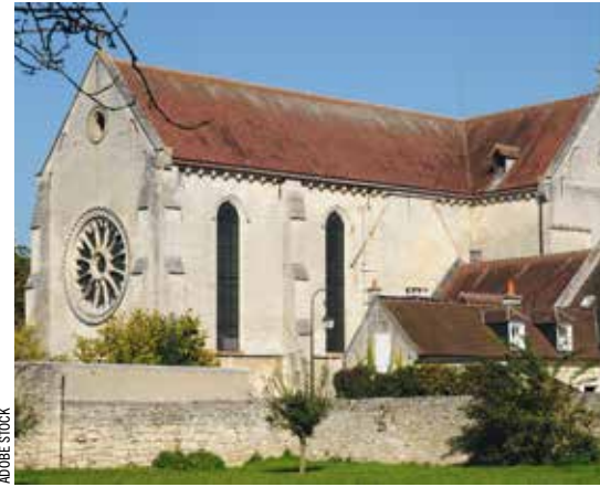
Église de Saint-Jean-aux-Bois.

Sauvegarder le patrimoine n'est pas l'affaire de certains, mais bien de tous. «Laisser tomber le patrimoine religieux, c'est un aveu d'échec pour notre Répu-