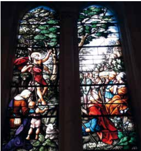
Vitrail de saint Jean-Baptiste (église Saint-Jean-Baptiste du Plessis-Belleville).