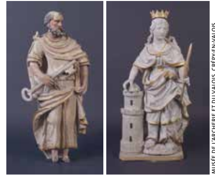
MUSÉE DE L'ARCHERIE ET DU VALOIS, CRÉPY-EN-VALOIS

En dehors de ces temps forts, les collections d'art sacré, et les salles où elles sont exposées, sont de pures merveilles. On y croise d'éminents personnages comme saint Jean-Baptiste et sainte Anne, et des saints plus modestes comme