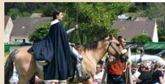
Spectacle de la kermesse 2022 sur sainte Jeanne d'Arc dans le Valois.

retenez cette date! C'est la grande kermesse paroissiale au château de la Douve, à Béthisy-Saint-Pierre. Au programme, la messe en extérieur à 11 heures, restauration sur place, de nombreux stands, petit bric-à-brac, friperie, tombola et le grand spectacle équestre