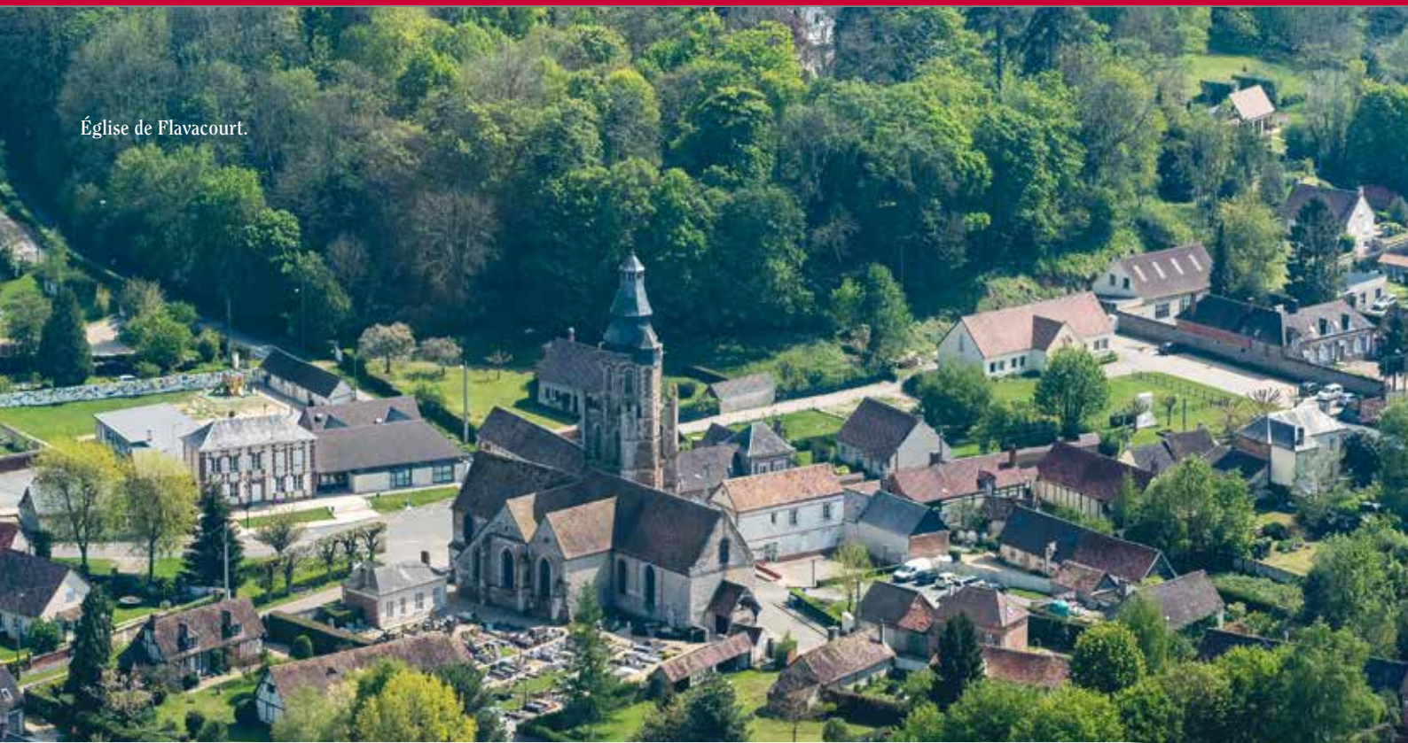
Église de Flavacourt.