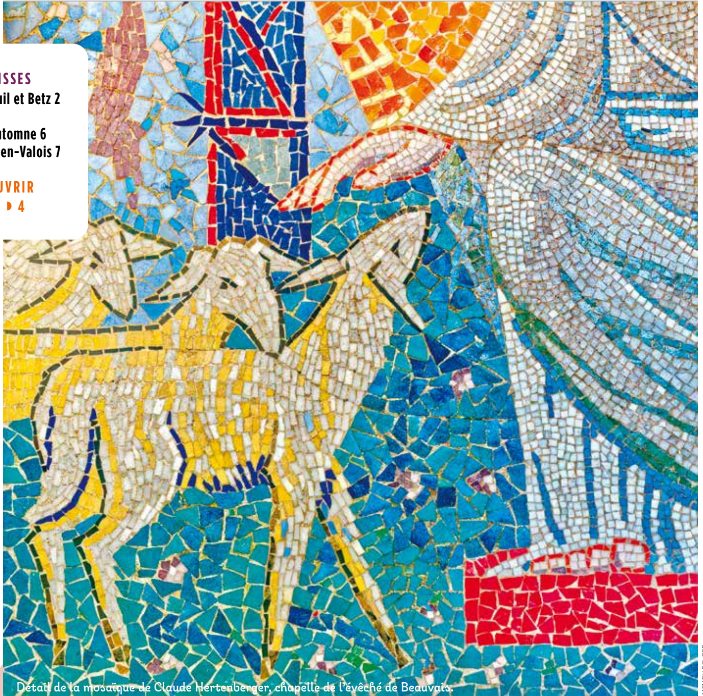
Détail de la mosaïque de Claude Hertzenberger, chapelle de l'évêché de Beauvais.