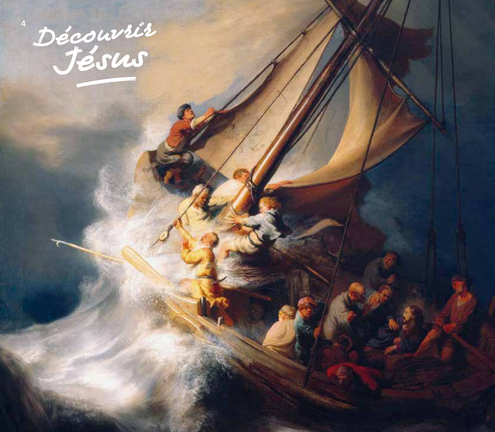
« Le Christ dans la tempête sur la mer de Galilée » de Rembrandt, détail (1633). Oeuvre volée au musée Gardner, Boston (États-Unis) en 1990.