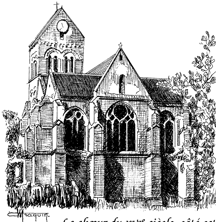
Le chœur du XVI e siècle, côté est

Le portail est moderne avec sept marches. La nef à modillons avec têtes monstrueuses. Fenêtres à plein cintre cachées par les collatéraux. Le chœur est carré. Sur les baies latérales, pignons ornés de crochets. Contreforts à clochetons. Gargouilles. Voûtes revêtues de pendentifs et d'écussons. Nef et collatéraux lambrissés, réparés en 1760. Magnifiques vitraux, l'un des ensembles les plus remarquables du département de l'Oise. Ceux du chœur datent de 1540.