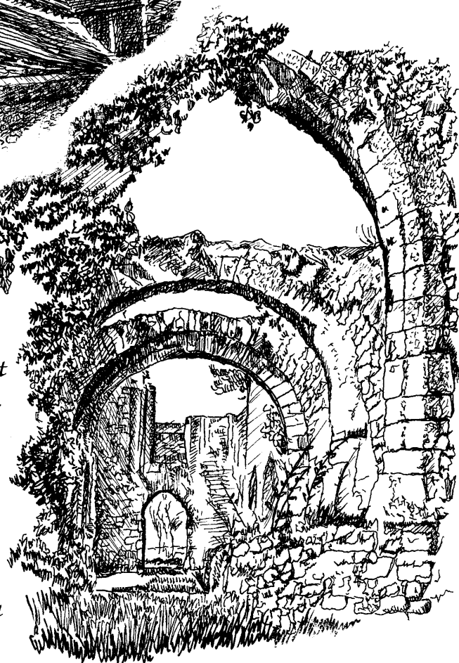
Ruines de Notre-Dame de Champlieu

Au nord d'Orrouy, en lisière de la forêt de Compiègne, le long de l'ancienne voie antique reliant Senlis à Soissons, se trouvent les ruines romantiques et solitaires de l'église Notre-Dame de Champlieu. Une nécropole et une église du haut Moyen-Âge avaient précédé l'édifice actuel dont la ruine remonte à 1814. L'église comprend deux parties : le chœur et les croisillons bâtis fin XI e siècle. La nef en pierres de taille est d'un siècle postérieur.