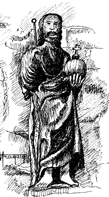
Christ tenant un globe