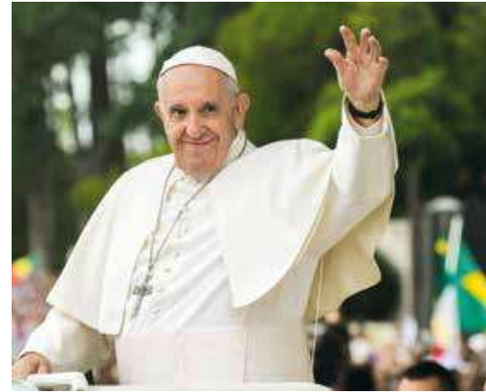
Le pape François à Fatima (Portugal), en 2017.

Bien souvent, nous sommes émerveillés par la beauté qu'offre la Terre. Mais savons-nous encore la regarder? Savons-nous la partager? Saurons-nous la transmettre? La nature nous trans-