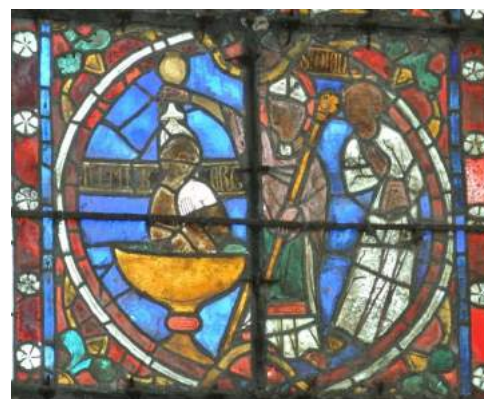
Baptême d'Amalbert par Saint Ouen (vitrail de la chapelle)

Le 17 novembre 1700, un incendie détruisit la chapelle où reposait le corps d'Amalbert.. C'est seulement en 1758, que ses restes furent transportés dans l'église abbatiale de Saint-Germer-de-Fly, où l'on trouve encore aujourd'hui une plaque portant : "Le 31 mars 1758, ont été mis sous ce tombeau les ossements de saint Amalbert, fils de saint Germer, trouvés, mais confondus avec quelques ossements, dans la chapelle de Saint-Pierre-en-Bos, dont la translation a été faite par le curé de Ferrières, à ce député par Mgr le cardinal de Gèvres, évêque de Beauvais, Requiescant in pace."