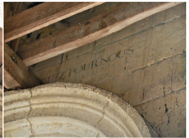
PRIEZ POUR NOUS