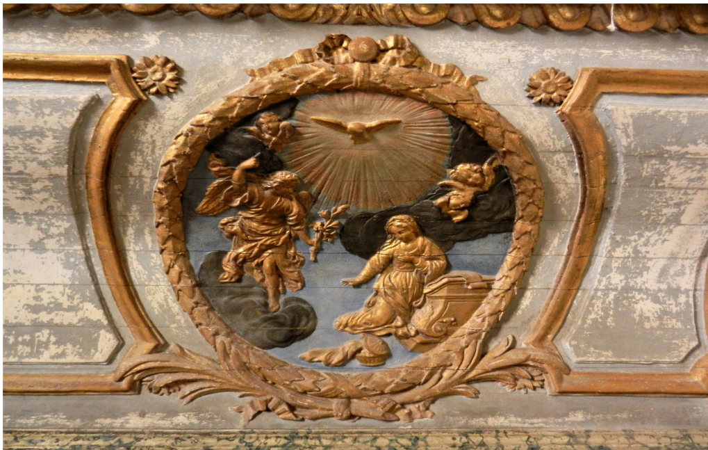
détail de l'autel pour célébrations dos à l'assemblée (avant Vatican II) situé derrière l'autel pour célébrations face au peuple