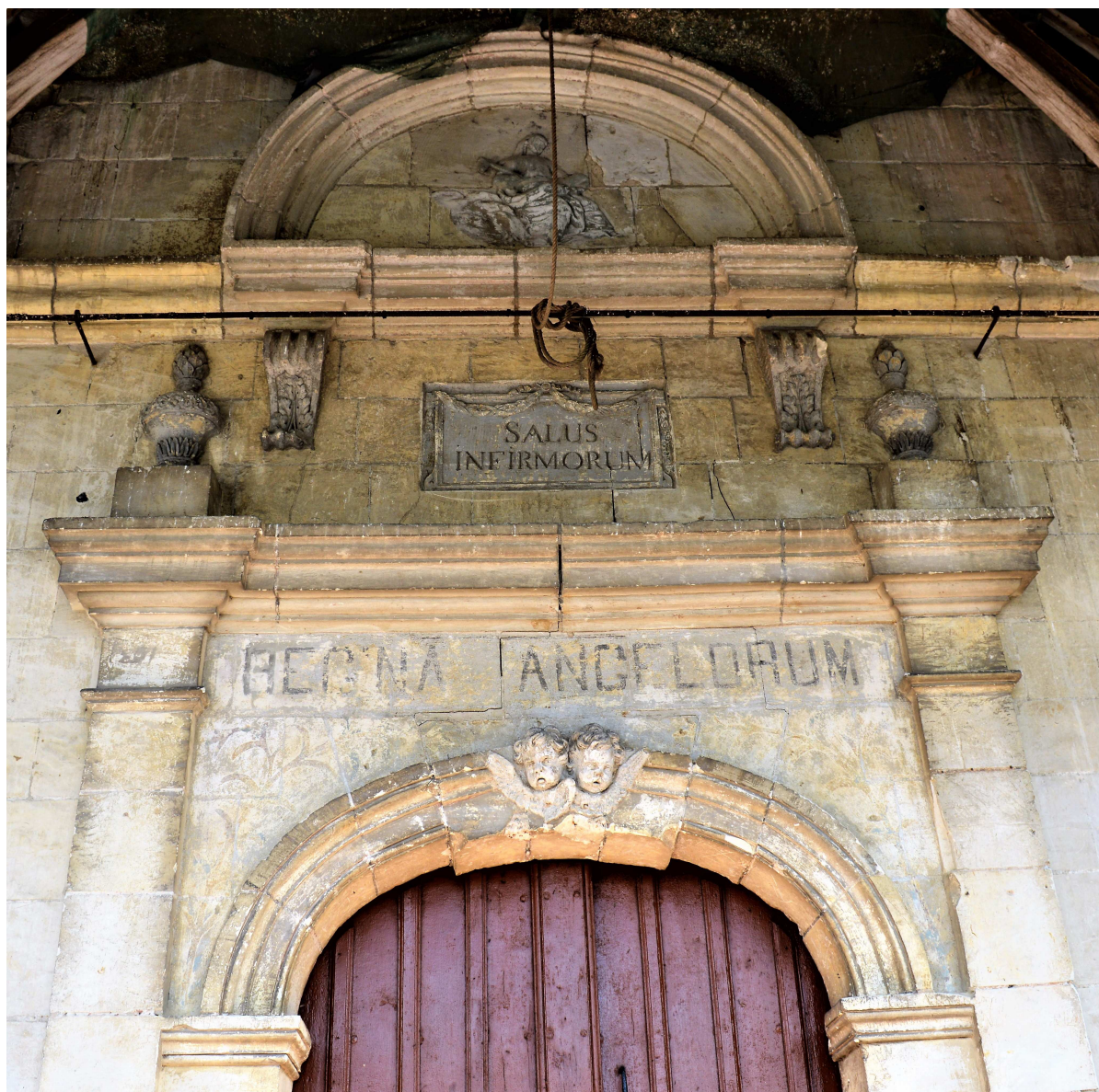
façade de la chapelle sous le caquetoir