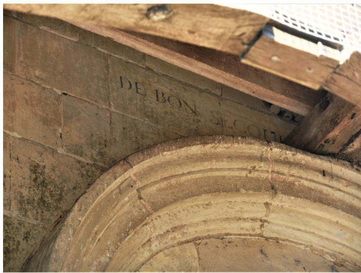
DE BON SECOURS