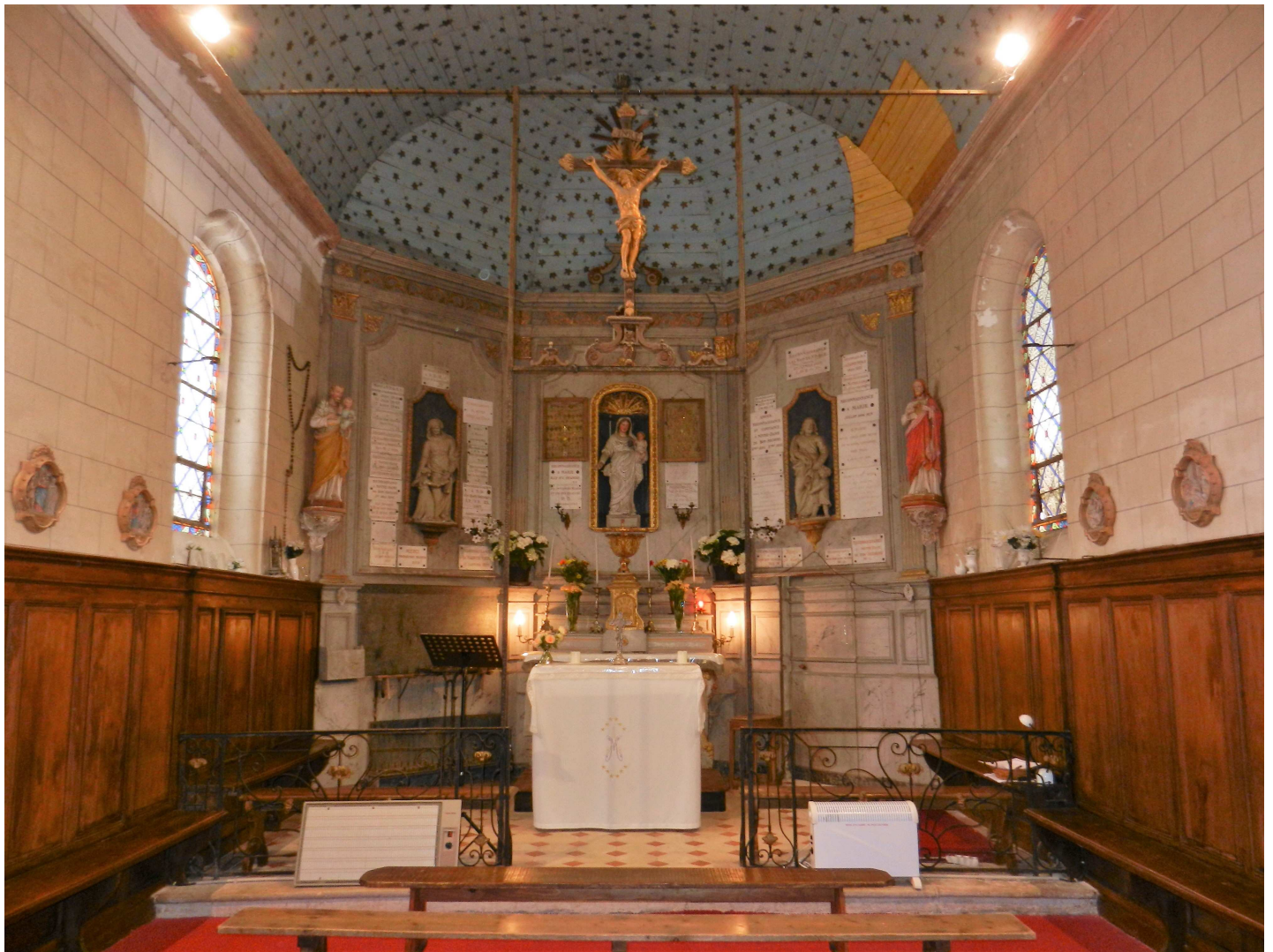
Intérieur de la chapelle pendant la neuvaine 2018 On remarque les nombreux ex-votos et médailles dans le chœur