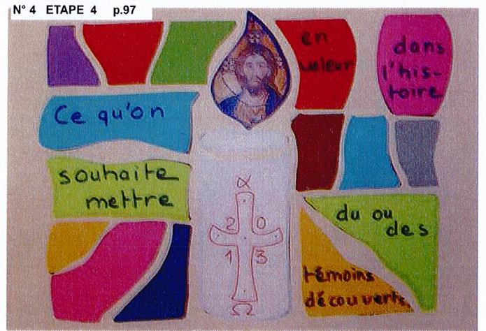
N° 4 ETAPE 4 p.97