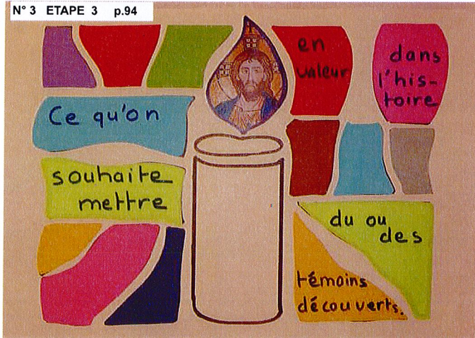
N° 3 ETAPE 3 p.94