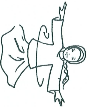
3. Si large... qu'on ne peut en faire le tour ! (tourner sur soi-même)