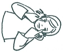
4. Si lumineux... (montrer ses yeux)