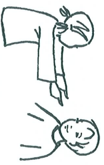
que je peux le voir dans tes yeux