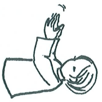
L'amour de Dieu est si merveilleux ! (x3)