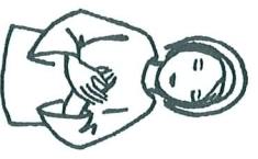
5. Si brûlant...