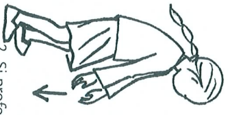
2. Si profond...