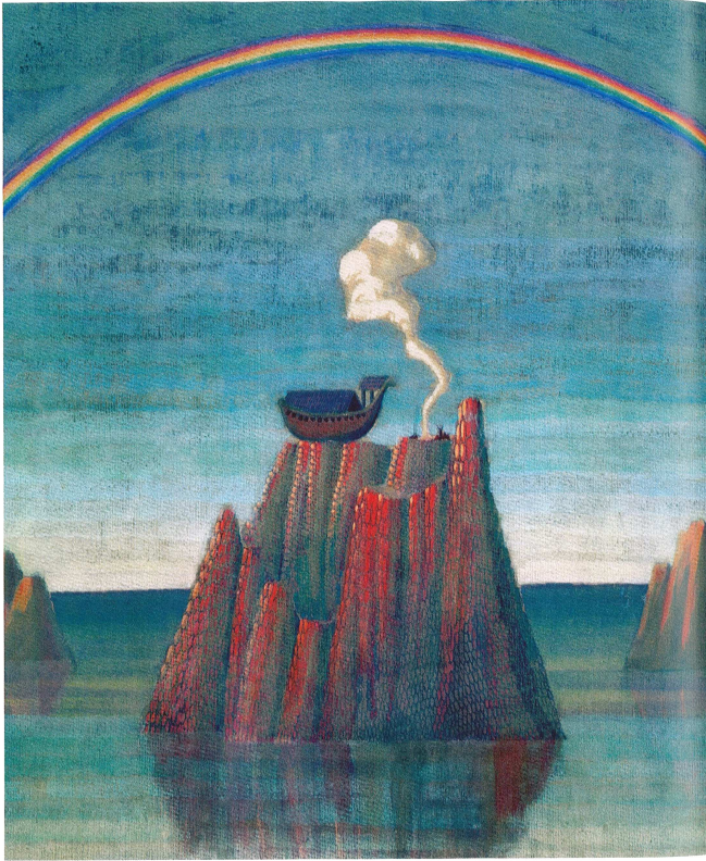
Une alliance en forme d'arc en ciel Gn 9,8-15