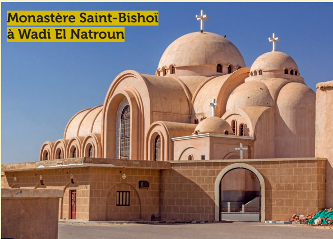
Monastère Saint-Bishoi à Wadi El Natroun