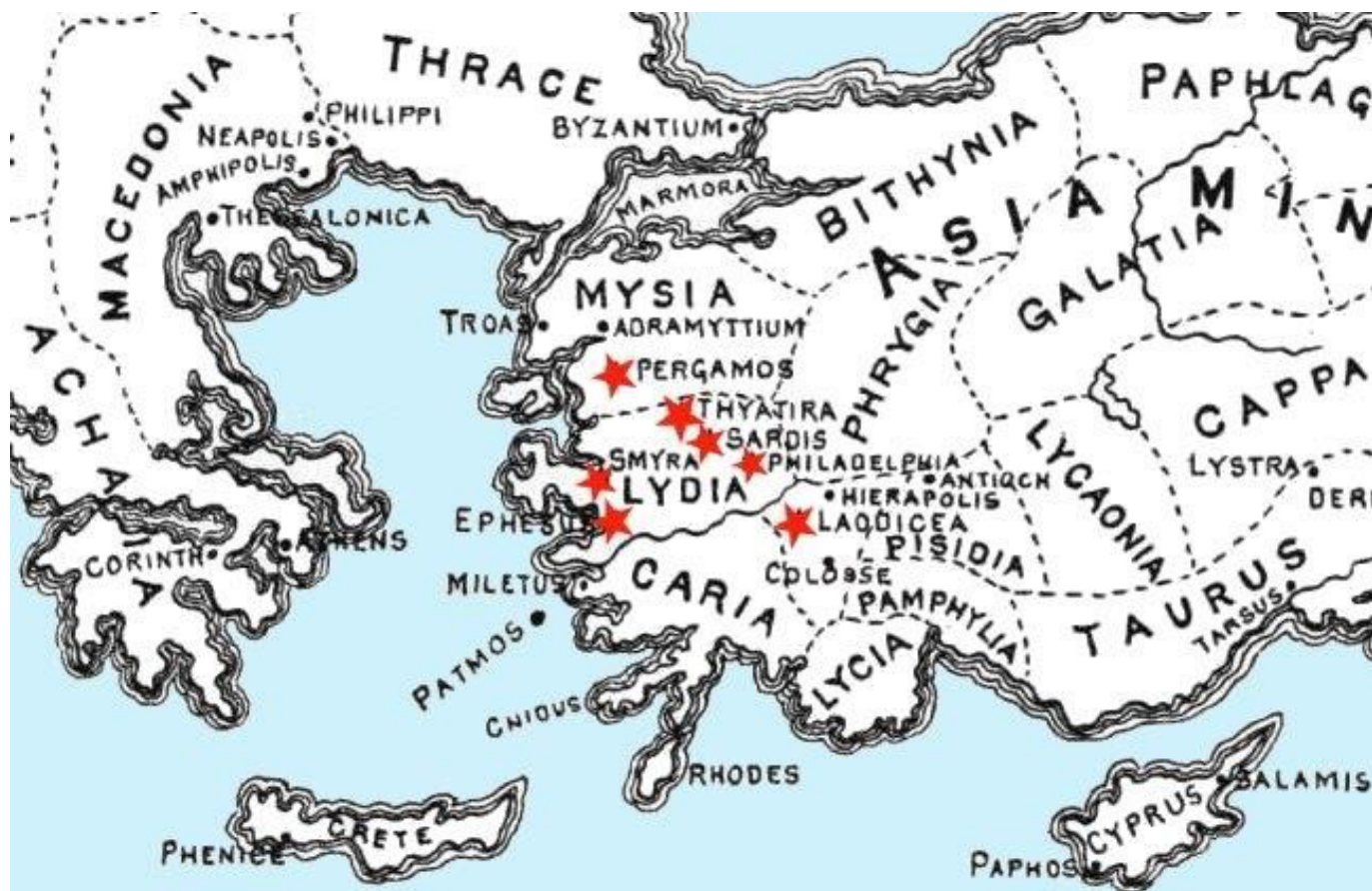
Carte des « 7 Eglises » du Livre de l'Apocalypse

NB : Ce programme est susceptible de modifications en fonction des confirmations des réservations des messes et de la disponibilité des intervenants pour les rencontres envisagées.