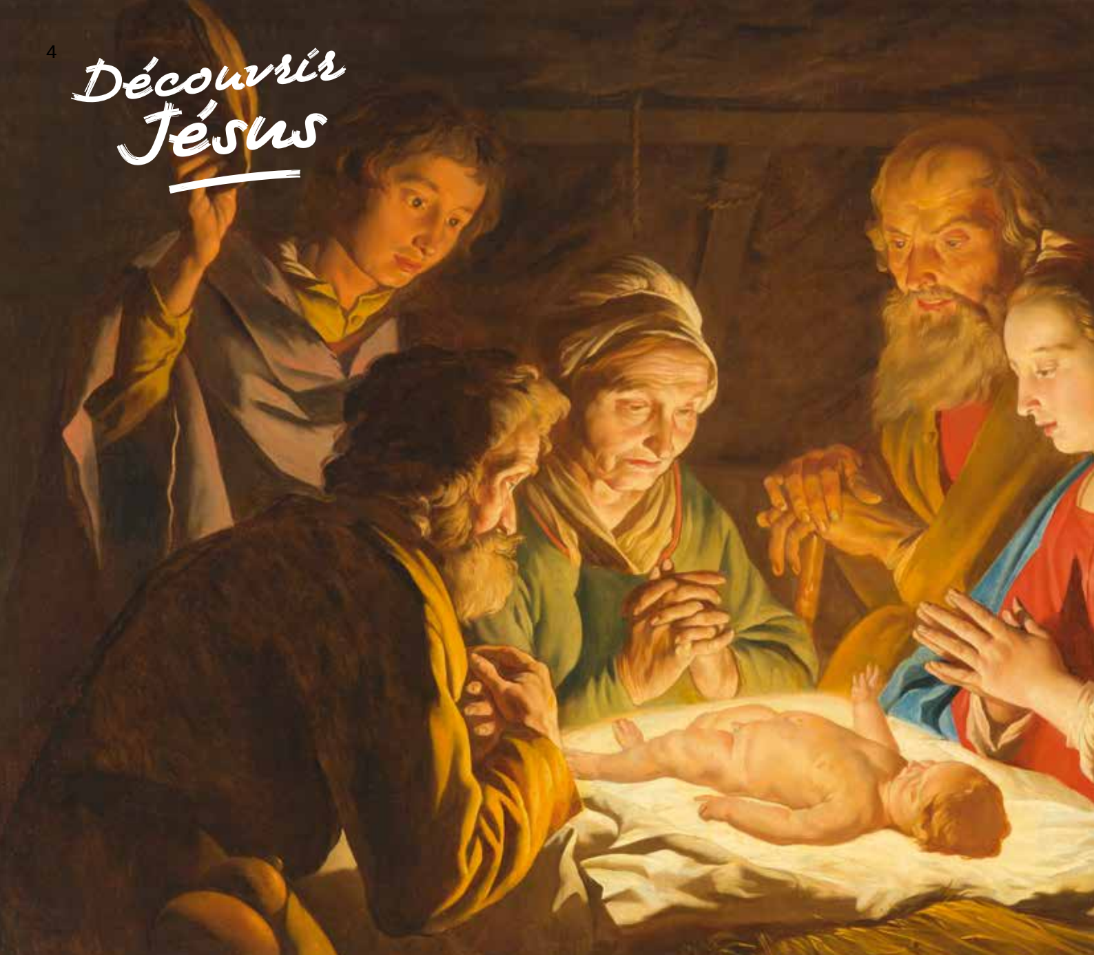
« L'adoration des bergers », de Matthias Stom (vers 1615-1649), collection du North Carolina Museum of Art.