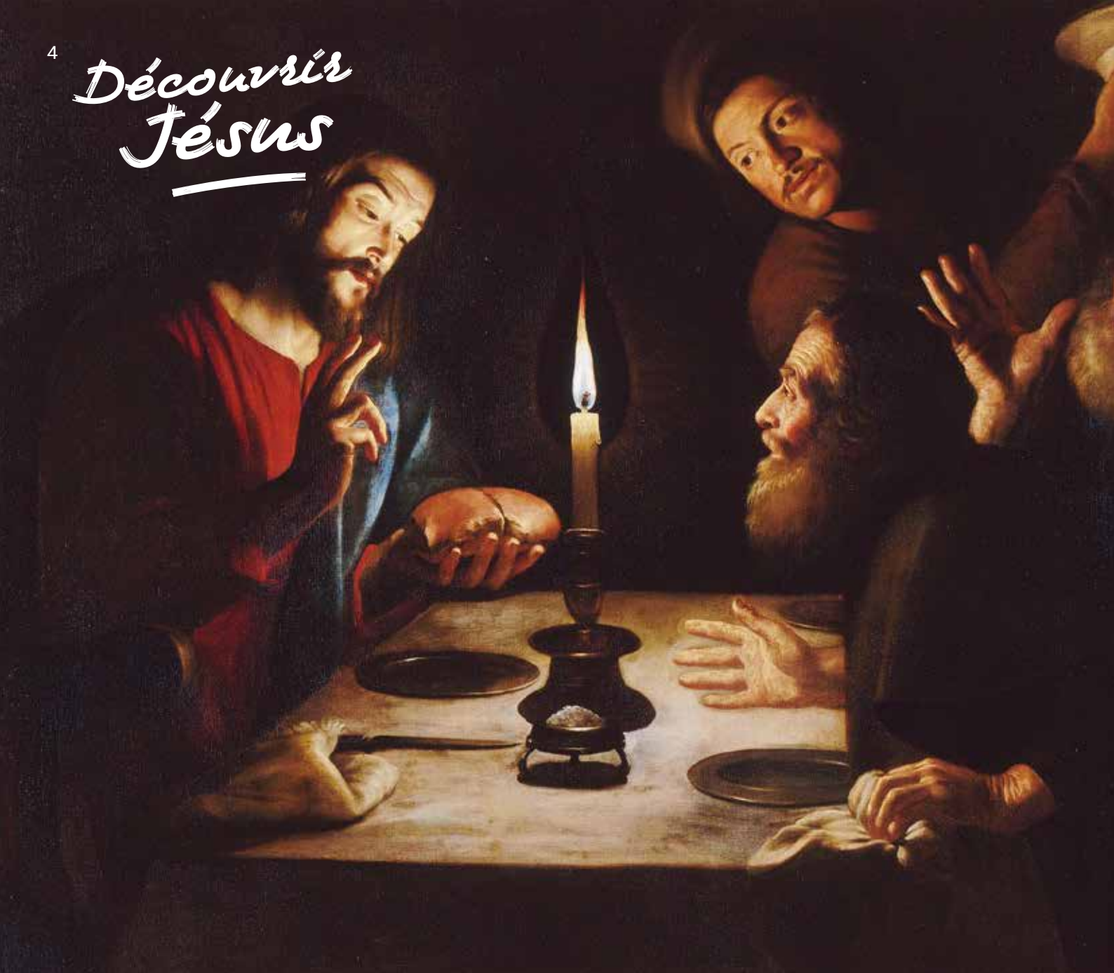
« Le repas d'Emmaüs » de Trophime Bigot (XVII e siècle), musée Condé, Chantilly.