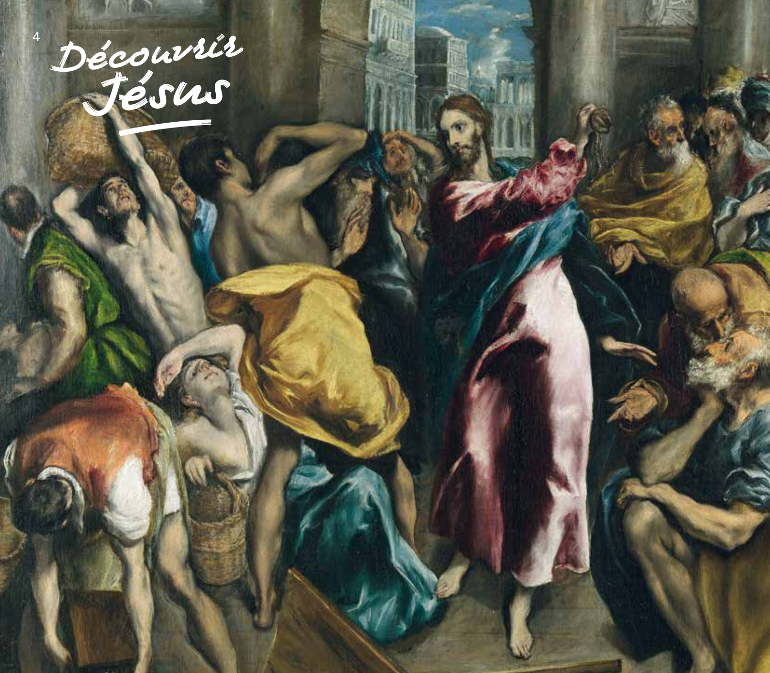
Le Christ chassant les marchands du Temple, par Le Greco (vers 1600, National Gallery, Londres).