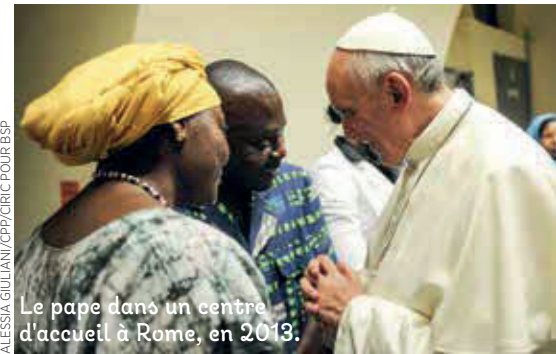
Le pape dans un centre d'accueil à Rome, en 2013.

« L e Ciel nous bénira si, sur terre comme sur mer, nous savons prendre soin des plus faibles, si nous savons surmonter la paralysie de la peur et le désintéret qui condamne à mort, avec des gants de velours. Dieu, en effet, a béni Abraham qui a été appelé à quitter sa terre d'origine... Hôte et pèlerin en terre étrangère, il accueillait les voyageurs qui passaient devant sa tente... et "pour prix de son hospitalité, il reçut la récompense d'une postérité" (saint Ambroise de Milan). Aux racines des trois monothéismes méditerranéens se trouve donc l'hospitalité, l'amour de l'étranger au nom de Dieu... Croyants, nous devons donc être exemplaires dans l'accueil mutuel et fraternel. Souvent les relations entre les groupes religieux ne sont pas faciles, à cause du virus de l'extrémisme et du fléau idéologique du fondamentalisme qui rongent la vie réelle des communautés... Je vous