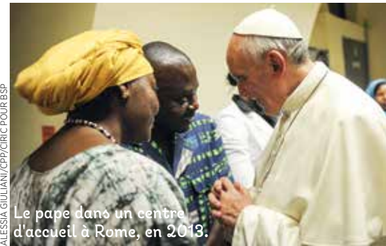
Le pape dans un centre d'accueil à Rome, en 2013.

« Le Ciel nous bénira si, sur terre comme sur mer, nous savons prendre soin des plus faibles, si nous savons surmonter la paralysie de la peur et le désintérêt qui condamne à mort, avec des gants de velours. Dieu, en effet, a béni Abraham qui a été appelé à quitter sa terre d'origine... Hôte et pèlerin en terre étrangère, il accueillait les voyageurs qui passaient devant sa tente... et "pour prix de son hospitalité, il reçut la récompense d'une postérité" (saint Ambroise de Milan). Aux racines des trois monothéismes méditerranéens se trouve donc l'hospitalité, l'amour de l'étranger au nom de Dieu... Croyants, nous devons donc être exemplaires dans l'accueil mutuel et fraternel. Souvent les relations entre les groupes religieux ne sont pas faciles, à cause du virus de l'extrémisme et du fléau idéologique du fondamentalisme qui rongent la vie réelle des communautés... Je vous