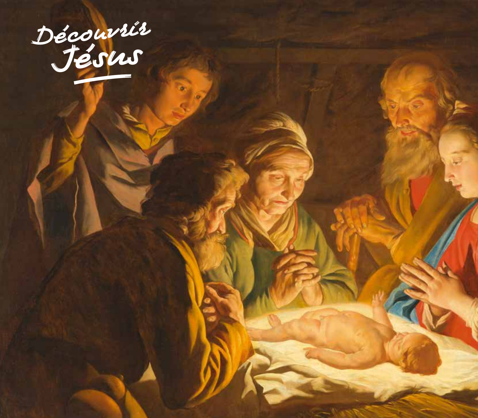
« L'adoration des bergers », de Matthias Stom (vers 1615-1649), collection du North Carolina Museum of Art.