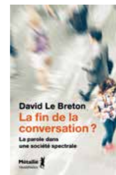
David Le Breton, La fin de la conversation ? , éditions Métailié, 126 pages.