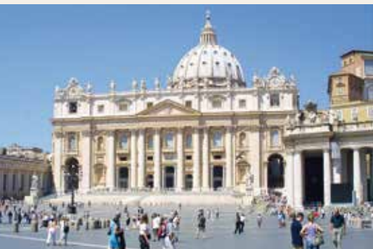
MOMENTUM - STOCKADOBEE.COM