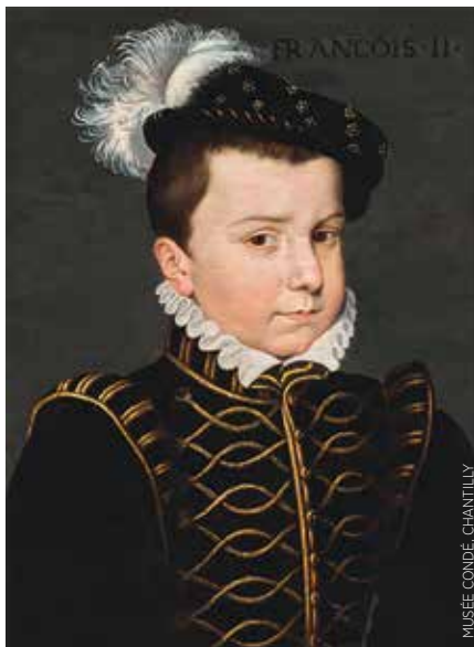
Le Portrait du jeune François par François Clouet (vers 1561), une acquisition récente et majeure.

Les Amis jouent un rôle essentiel ; pendant trente ans, je n'aurais rien pu faire sans eux : ils donnent chaque année au musée Condé environ 300 000 euros pour restaurer les collections et les salles. En 2023, ils ont permis de restaurer plusieurs