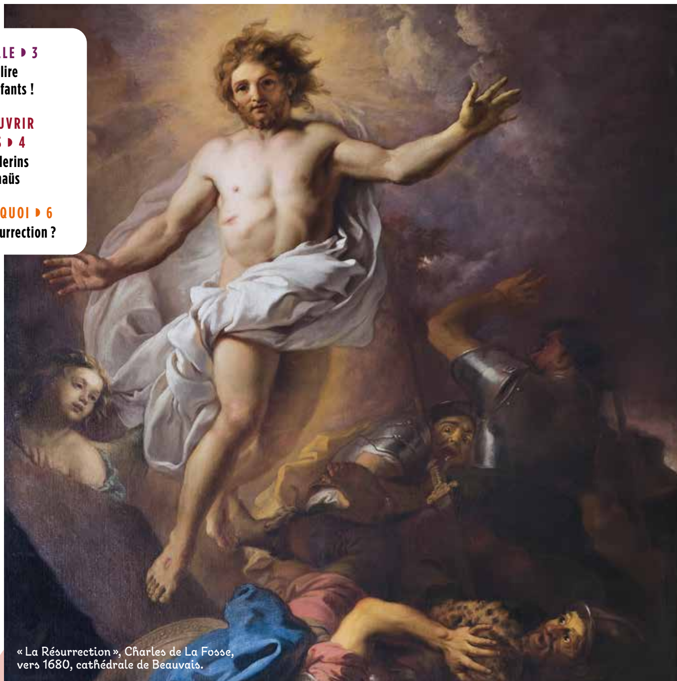
« La Résurrection », Charles de La Fosse, vers 1680, cathédrale de Beauvais.