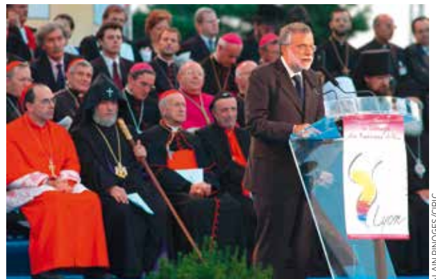
Andréa Riccardi, le fondateur de Sant'Egidio en 2005 à Lyon (France), lors de l'Appel de la paix.