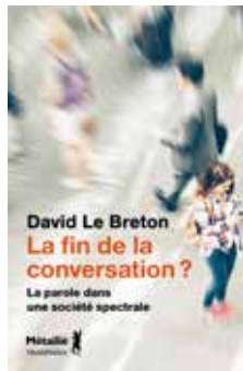
David Le Breton, La fin de la conversation ? , éditions Métailié, 126 pages.

David Le Breton. Dans nos sociétés de l'hyperconnexion, les conversations qui sollicitent un face-à-face ou plutôt, un visage à visage, une écoute, une attention à l'autre, deviennent rares. Souvent, elles sont rompues par des interlocuteurs toujours là physiquement, mais qui disparaissent soudain, après la sonnerie de leur smartphone ou dans le geste addictif de retirer l'appareil de leur poche, dans la quête lancinante d'une notification quelconque. Ils abandonnent leur interlocuteur, qui reste les bras ballants, en se demandant que faire de ce temps où on l'a éteint en appuyant sur la touche « pause » de son existence.