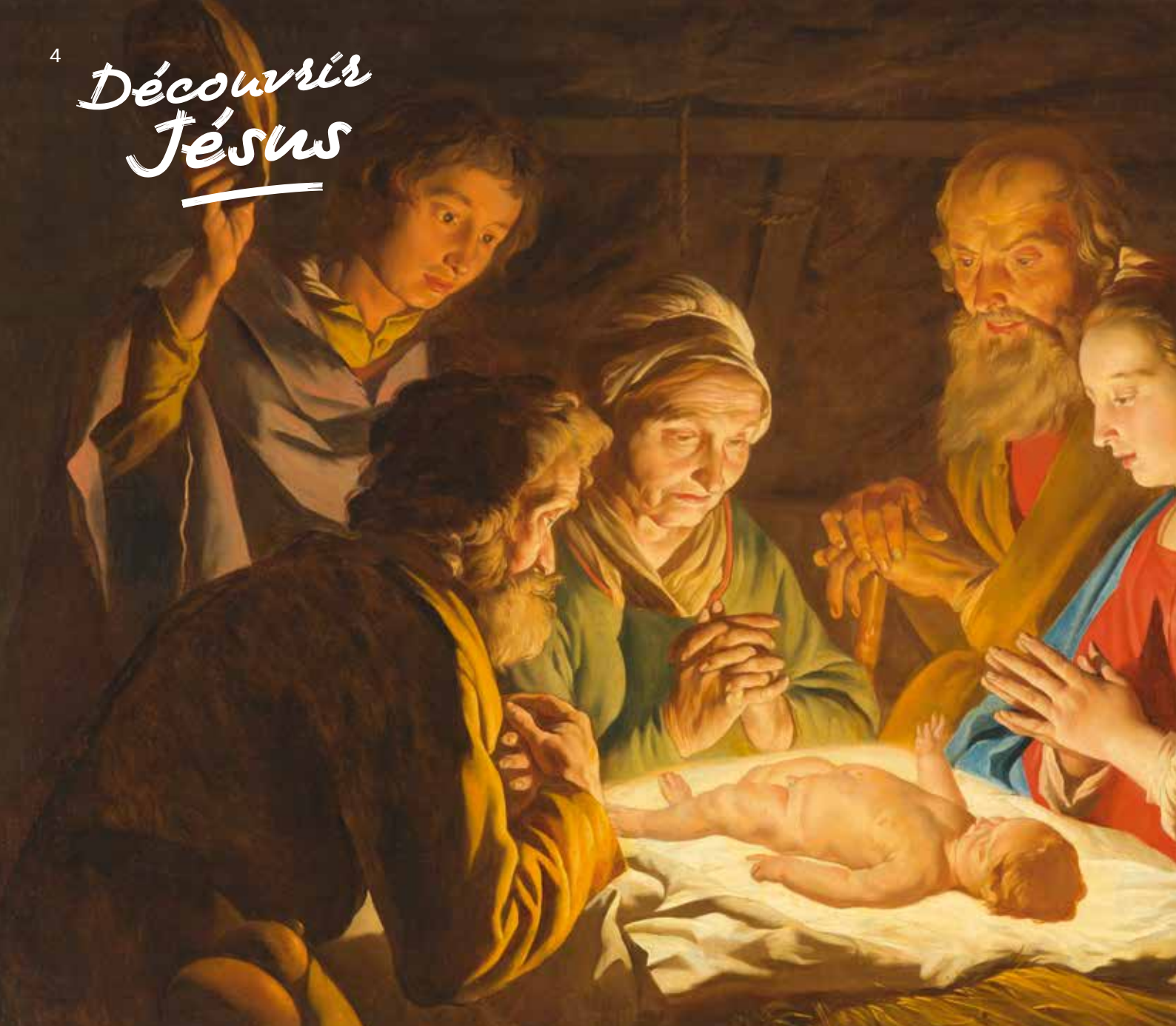
« L'adoration des bergers », de Matthias Stom (vers 1615-1649), collection du North Carolina Museum of Art.