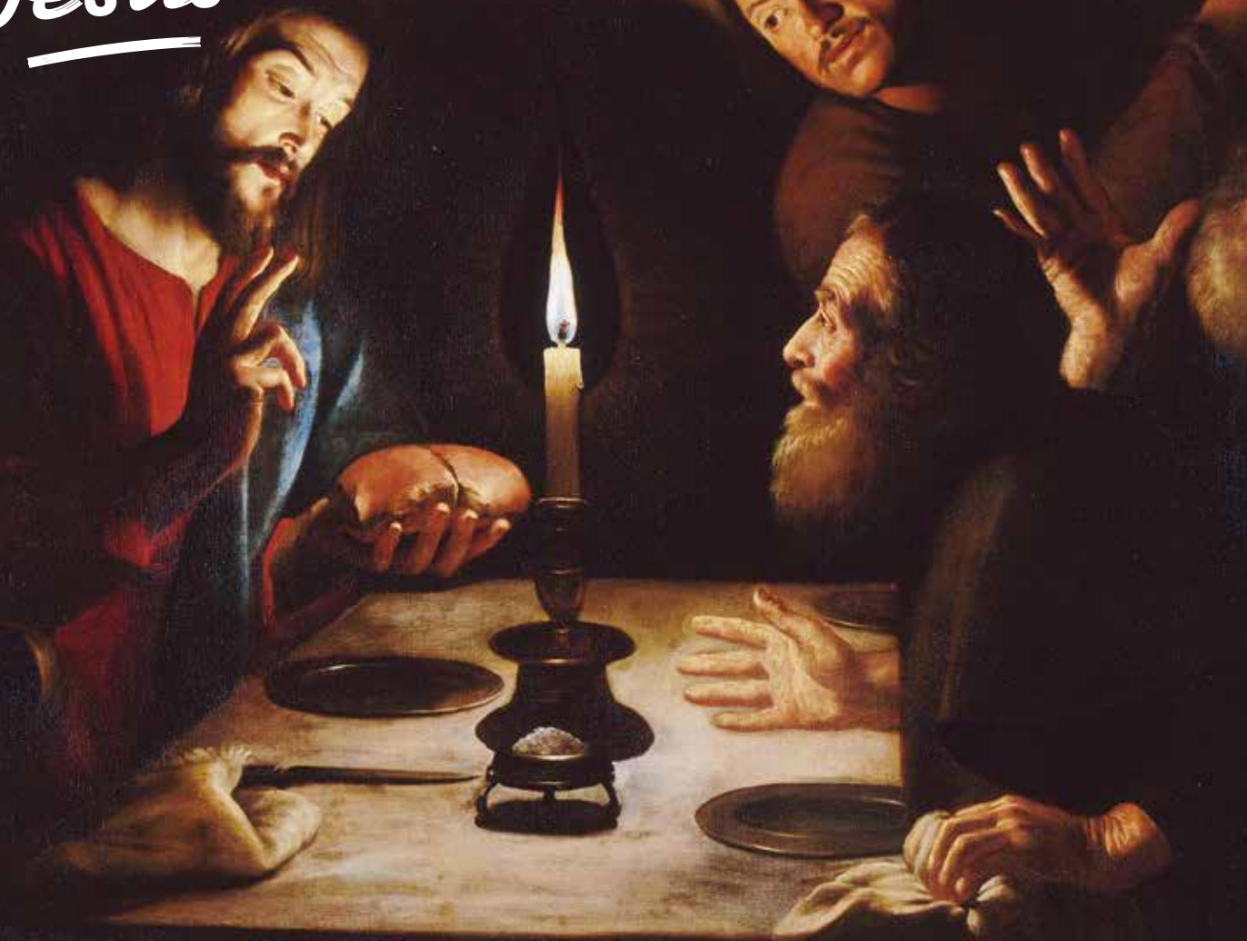
« Le repas d'Emmaüs » de Trophime Bigot (XVII e siècle), musée Condé, Chantilly.