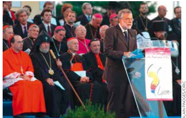
Andréa Riccardi, le fondateur de Sant'Egidio en 2005 à Lyon (France), lors de l'Appel de la paix.