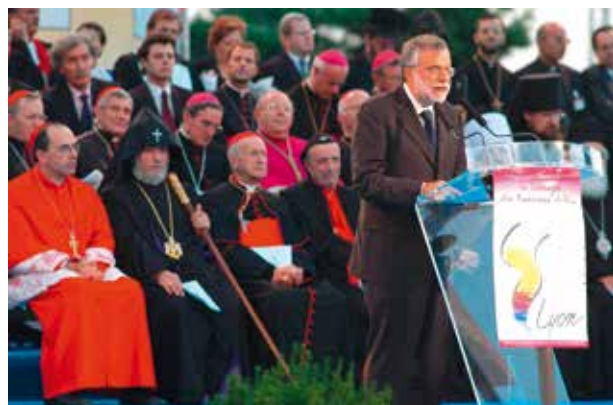
Andréa Riccardi, le fondateur de Sant'Egidio en 2005 à Lyon (France), lors de l'Appel de la paix.