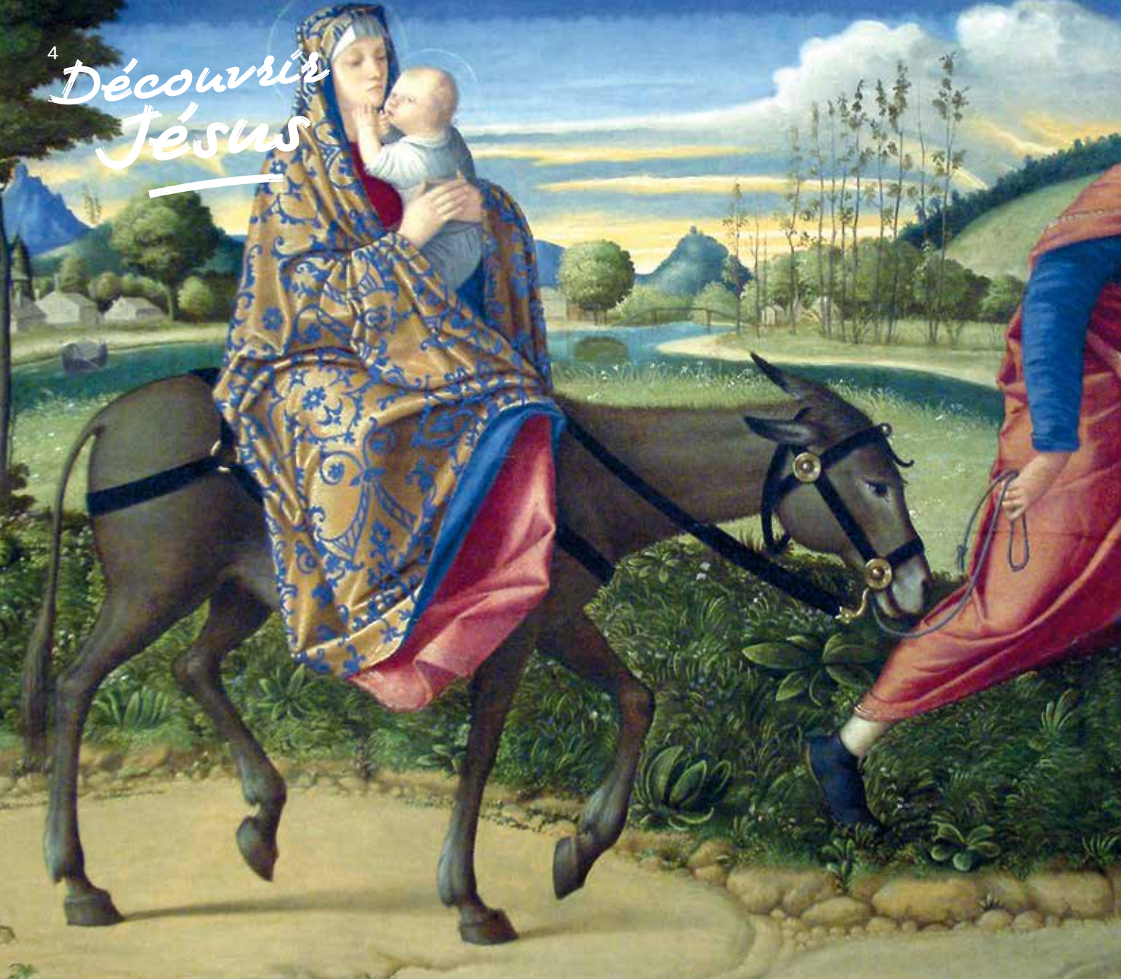
« La fuite en Égypte » de Vittore Carpaccio (1465–1526), National Gallery of Art, Washington.