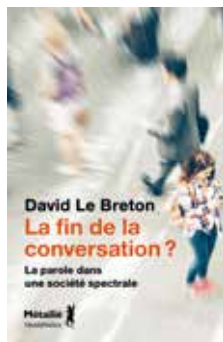
David Le Breton, La fin de la conversation ? , éditions Métailié, 126 pages.

David Le Breton. Dans nos sociétés de l'hyperconnexion, les conversations qui sollicitent un face-à-face ou plutôt, un visage à visage, une écoute, une attention à l'autre, deviennent rares. Souvent, elles sont rompues par des interlocuteurs toujours là physiquement, mais qui disparaissent soudain, après la sonnerie de leur smartphone ou dans le geste addictif de retirer l'appareil de leur poche, dans la quête lancinante d'une notification quelconque. Ils abandonnent leur interlocuteur, qui reste les bras ballants, en se demandant que faire de ce temps où on l'a éteint en appuyant sur la touche « pause » de son existence.