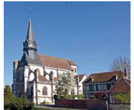
L'église Notre-Dame de Marissel