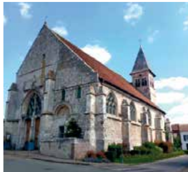
L'église Notre-Dame d'Allonne

Abonnez-vous à l'info-lettre commune aux trois paroisses en envoyant une demande à : cathedrale@wanadoo.fr