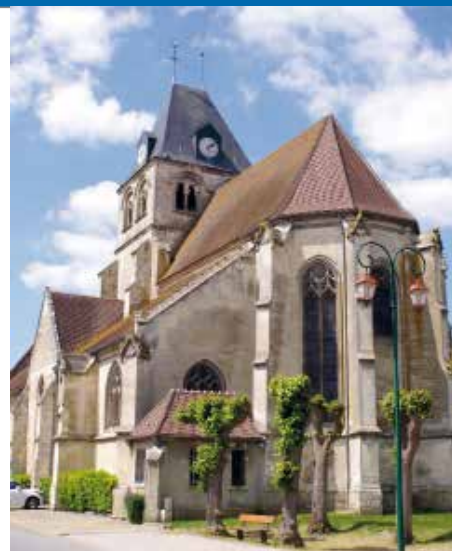
L'église Notre-Dame de la Nativité à La-Neuville-en-Hez.

Ainsi, par un beau dimanche, notre pèlerinage pourrait partir de Notre-Dame du Thil, puis direction Velennes, Rémérangles, La-Neuville-en-Hez, et retour vers Allonne, Marissel et la Basse-Œuvre. Qui dit pélé, dit prière. Se munir donc de son chapelet. Sept églises, donc, après les premières prières du chapelet, on se met en route pour cinq étapes comme cinq dizaines du «Je vous salue Marie» et une arrivée pour la messe de 18 heures à la Basse-Œuvre, après une ballade d'environ 50 km. Avis aux amateurs !