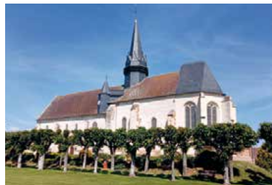
L'église Notre-Dame et Saint-Gengon de Rémérangles.

Au fait, quel est le troisième saint particulièrement honoré dans nos églises ? Il s'agit de saint Lucien, que l'on dit avoir été le premier évêque de Beauvais. Il aurait été martyrisé à Montmille au III e siècle.