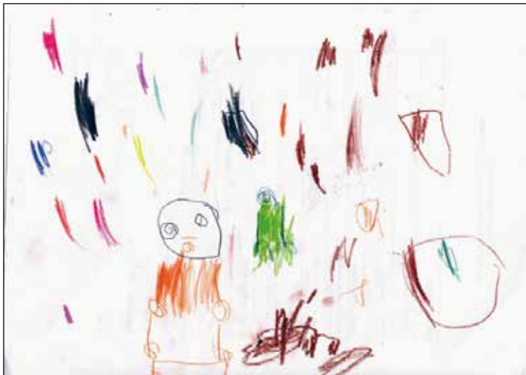
Dessin Sibylle 22 avril 2020.

Cette configuration a sollicité la part d'adap-