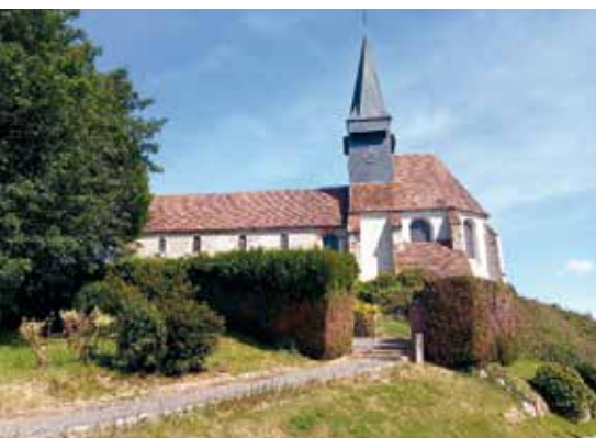
L'église Notre-Dame de la Nativité à Velennes.