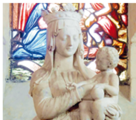
Vierge à l'Enfant, Saint-Vaast, Boran-sur-Oise.