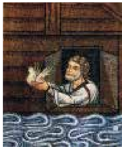
Noé fait sortir une colombe de l'arche (mosaïque de la basilique Saint-Marc de Venise, XII e siècle).

Après quarante jours, la pluie s'arrête, mais la terre est entièrement sous l'eau. La décrue s'amorce, et un jour, Noé lâche une colombe qui revint avec un rameau d'olivier au bec. Il la relâche sept jours après et elle ne revient plus, signe que la terre se découvre de plus en plus. Au bout de quelques mois, l'arche repose sur le mont Ararat (dans l'actuelle Turquie). Lorsque la terre est enfin sèche, Dieu dit à Noé de faire sortir tous les animaux et leur enjoint de se multiplier à nouveau sur la surface de la Terre. Dieu fait alors alliance avec Noé et ses fils, leur donne pour nourriture tout animal ou végétal, condamne le meurtre, et leur ordonne d'être féconds. Puis il promet qu'il n'y aura plus de déluge et désigne l'arc-en-ciel comme rappel du déluge et en signe d'alliance entre lui et la terre.