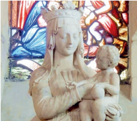
Vierge à l'Enfant, Saint-Vaast, Boran-sur-Oise.