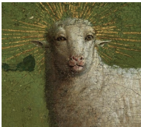
Détail : l'Agneau mystique restauré.

Retenons surtout le panneau central inférieur et contemplons sans bruit l'Adoration de l'Agneau de Dieu. Dans un paysage luxuriant qui porte à imaginer la Jérusalem céleste, un jardin paradisiaque avec une ligne d'horizon assez haute, fermée par un bosquet d'arbres autour d'un beffroi qui rappelle celui de la cathédrale d'Utrecht, fixe le décor de l'Agneau, debout sur un autel et entouré de nombreux personnages abîmés dans leur prière et attentifs à la liturgie. La scène est éclairée par une colombe qui rappelle la présence essentielle de l'Esprit