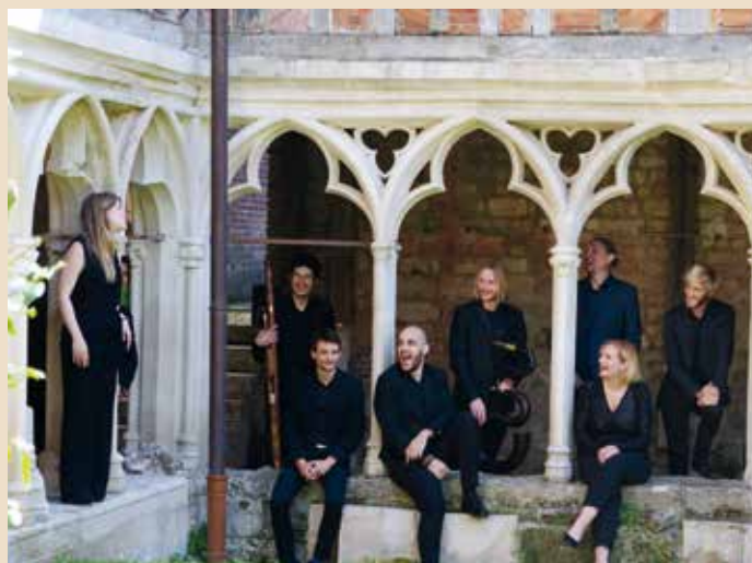
Moment de détente dans le cloître pour les musiciens de l'ensemble Harmonia Sacra après le concert.

La restitution sonore à laquelle l'ensemble Harmonia Sacra a apporté son expertise sera diffusée à la fin du mois de décembre ou au début de janvier dans une émission Des racines et des ailes , consacrée à la cathédrale Saint-Pierre de Beauvais.