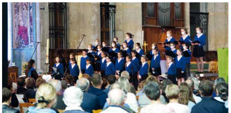
La Chorale maîtrisienne, le 3 juillet à la cathédrale de Beauvais.

Un des anges musiciens de la rose centrale de la chapelle Saint-Vincent. L'ensemble du vitrail qui date du XIV e siècle témoigne de la variété des instruments de musique qui étaient utilisés dans la cathédrale à cette époque.