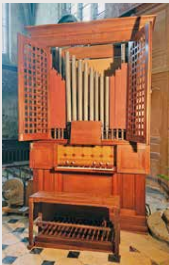
L'orgue de Verberie.

L'orgue, dont l'origine remonte à l'Antiquité, est un instrument incontournable de la liturgie catholique. Nos églises de la Vallée en comptent cinq. L'orgue de Morienvall date de 1990. Celui de Béthisy-Saint-Pierre, daté de 1857, en provenance de Compiègne, a été acquis par la paroisse en 1876. À Béthisy-Saint-Martin, c'est en 1991 qu'a été inauguré un petit orgue de série fabriqué en 1980. Enfin, à Verberie, nous avons le privilège d'avoir en tribune un orgue du fameux facteur Cavaillé Coll, celui-là même qui est l'auteur des grandes orgues de Notre-Dame de Paris. L'orgue de Verberie date de 1843 et est à sa place actuelle dans l'église depuis 1890 ; tout comme celui de la tribune de Béthisy-Saint-Pierre, il n'est pas actuellement en fonction et demande une remise en état que nous appelons tous de nos vœux. Mais voilà qu'à Verberie, nous sommes heureux d'accueillir un nouveau venu : un petit orgue de chœur, restauré pour l'occasion. L'instrument, de la première moitié du XIX e siècle, dormait depuis trente ans... Le voilà de nouveau opérationnel grâce aux bons soins de monsieur Garspard, ébéniste, et de monsieur Plet, facteur d'orgue. Qu'on se le dise et que Dieu soit honoré par la liturgie célébrée le plus dignement possible dans nos églises.