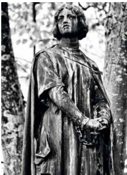
Statue de Jeanne d'Arc à Beaulieu.

En 2022, la paroisse organise un pèlerinage sur les pas de sainte Jeanne d'Arc à Beaulieu-les-Fontaines, le lundi 6 juin. Beaulieu est un petit village (12 km au nord de Noyon), aujourd'hui connu pour avoir été l'un des endroits de captivité de Jeanne d'Arc, après sa capture le